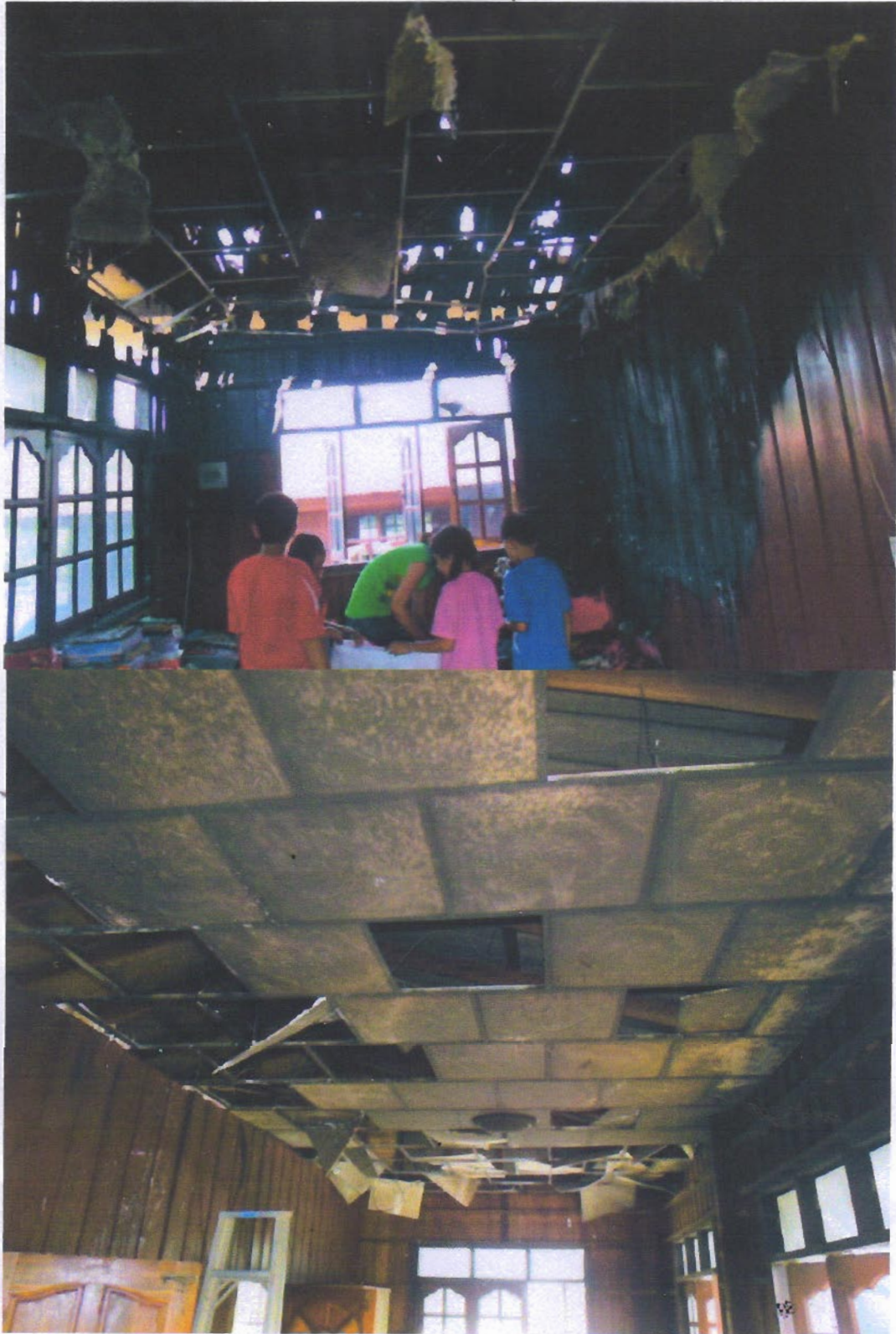
ภาพความเสียหายจากเหตุการณ์ไฟไหม้